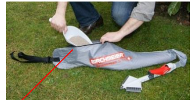
Grosse Einfüllöffnung mit Reissverschluss