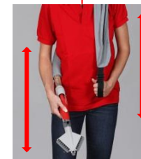
Flexible Anpassung der Streuhöhe

Streusalz Streusand Schottersubstrate usw.